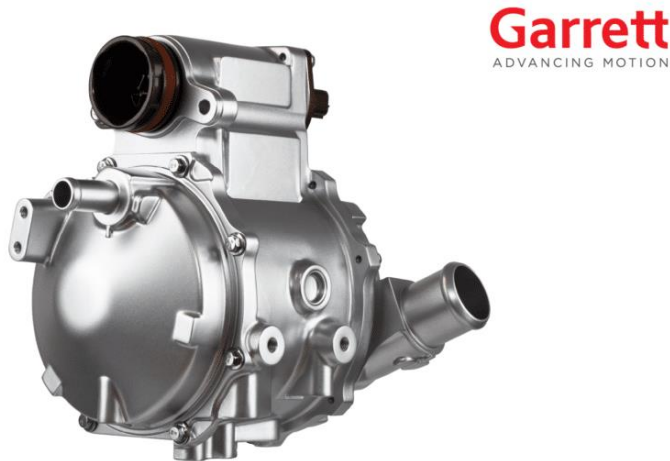
上图为盖瑞特氢燃料电池电动空压机

氢燃料电池电动空压机：盖瑞特第二代氢燃料电动空压机适用于乘用车和商用车，用于调节进入燃料电池系统的进气量，进而使之产生动力。新一代空压机的最大运行速度可达 150,000 转/分，高于行业标准，不仅提高了效率，而且体积更小。该空压机可选配涡轮膨胀端进行能量回收，能够将设备使用功率再降低 20%，减少氢气消耗量，增加续航里程。